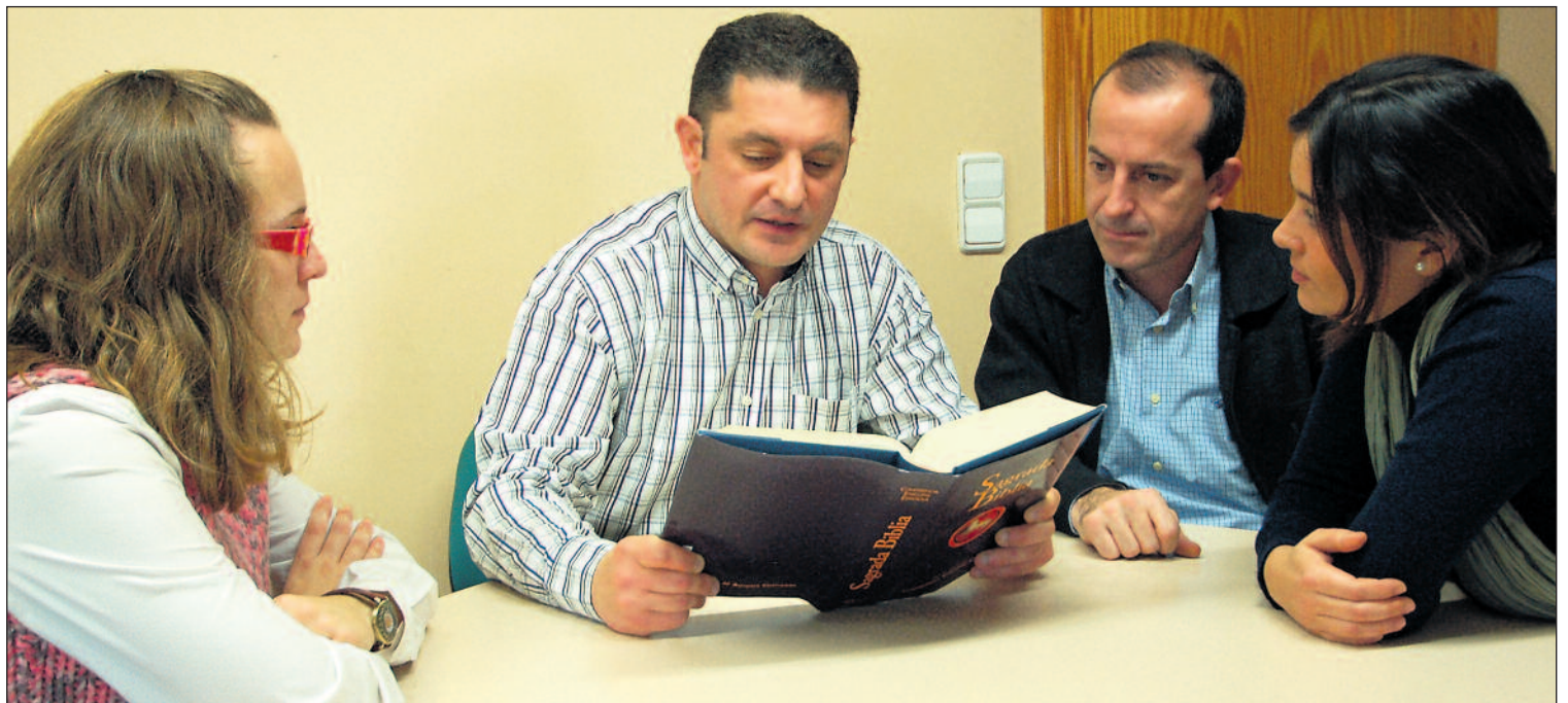
La 'lectio divina' es una lectura orante, personal o comunitaria, de la Biblia, acogida como palabra de Dios, en meditación, oración y compromiso cristiano. E.M.

dosa de las Escrituras, realizada con espíritu atento. La meditación ['meditatio'] es el trabajo de la mente estudiosa que, con ayuda de la propia razón, investiga la verdad oculta. La oración ['oratio'] es el impulso devoto del corazón hacia Dios, pidiéndole que aleje los males y conceda los bienes. La contemplación ['contemplatio'] es como una eleva-